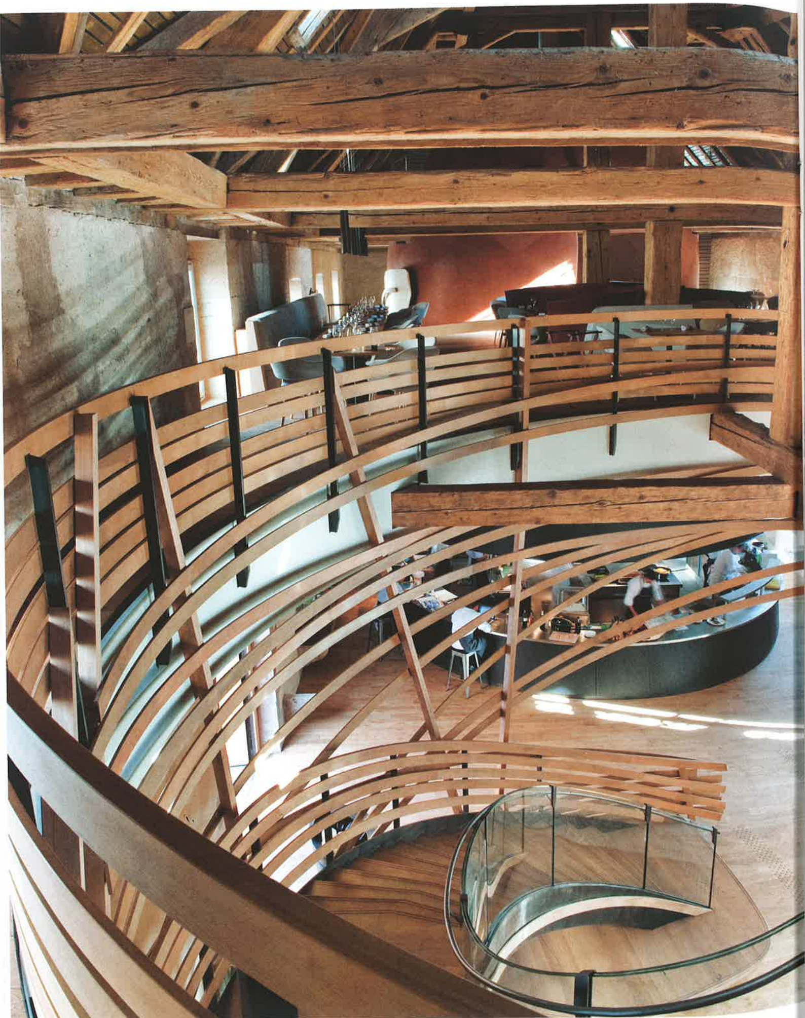
▲ L'escalier monumental mêle marches en chêne et garde-corps en lames de hêtre cintrées.