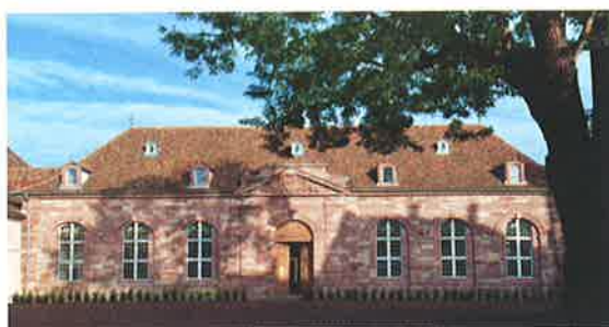
▲ L'ancienne écurie royale offre une façade en grès rose.