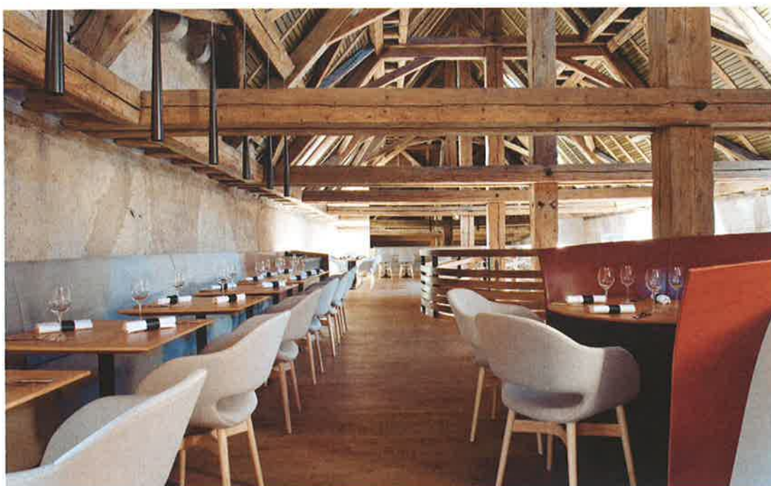
▲ Les fauteuils « Charme » à l'assise en tissu et au piètement en hêtre s'alignent à l'étage.

Maîtrise d'œuvre : Denu et Paradon (67) , architectes ; Jouin Manku (75) , architectes d'intérieur et designers / Maîtrise d'ouvrage : IRCAD EITS Institute / Entreprises bois : Arche du bois (67) , escalier et autre agencement ; Millet (67) , murs et sols / Mobilier et agencement : Pedralli (piètements tables) , Busnelli (chaises restaurant) , Ligne Roset (fauteuils) , Tolix (tabourets bar) , Pierre-Yves Le Floch (tapisseries, garnisseur) / Livraison : 2013 / Surface : 800 m 2 SHON / Volume de bois : n.c. / Lieu : Strasbourg (67)