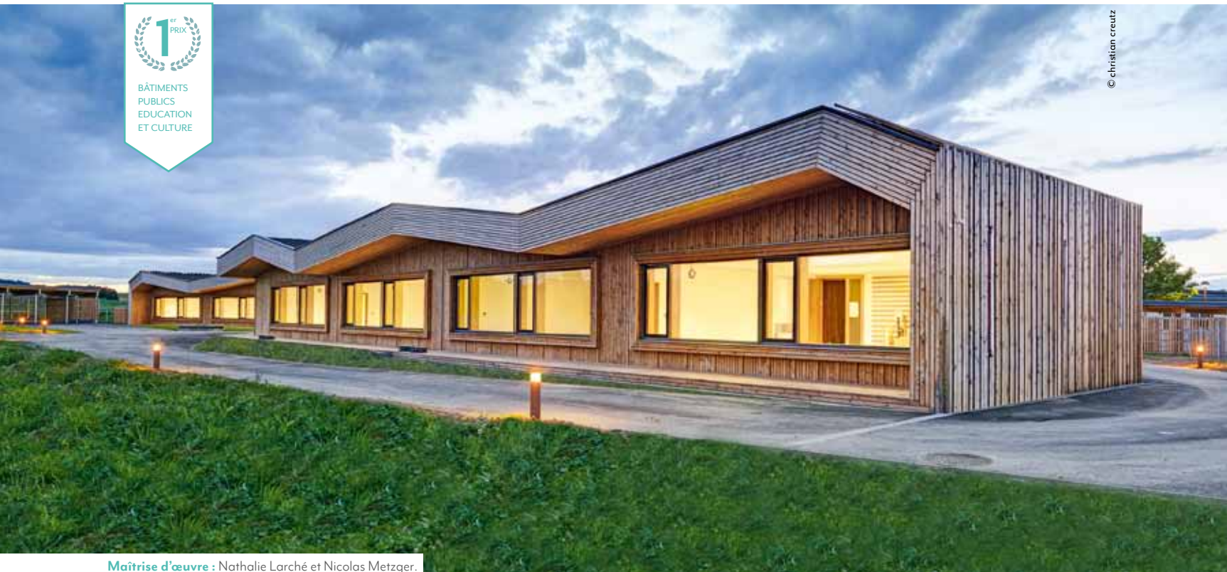
Maitrise d'œuvre : Nathalie Larché et Nicolas Metzger.

En quatre éditions et avec plus de 2 500 bâtiments présentés, le Prix national de la construction bois montre, en France, l'évolution de l'univers du bâtiment... et des mentalités. Présentation des lauréats 2015, d'un groupe scolaire lorrain bardé de douglas à un lycée nantais revêtu de pin.