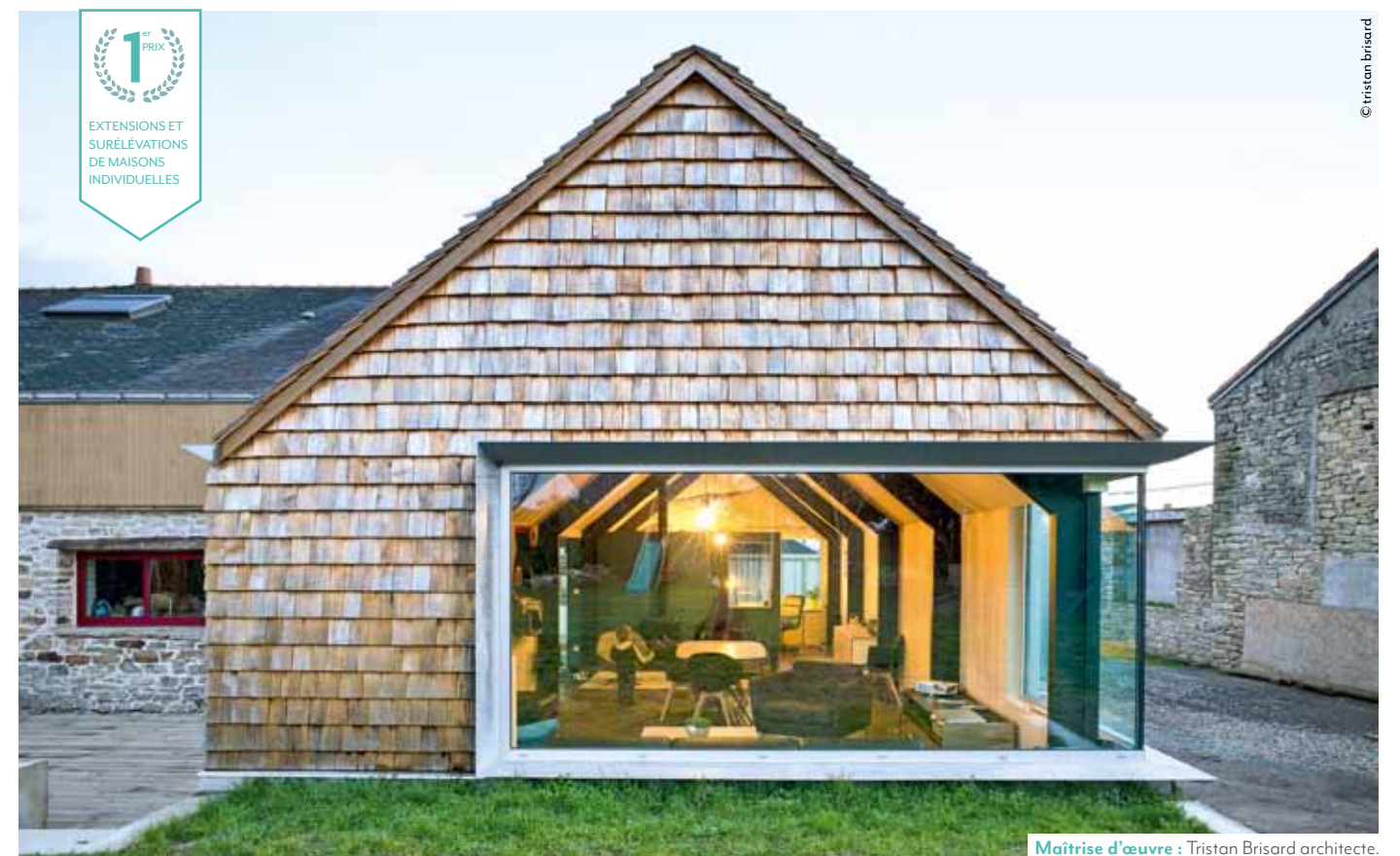
Maitrise d'œuvre : Tristan Brisard architecte.